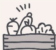
Paniers de fruits & légumes bio et de saison

Chaque panier comprend entre 6 et 8 sortes de légumes bio et entre 2 et 3 sortes de fruits bio et de saison !