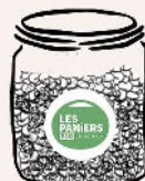
Bocal gourmand 500g Muesli, raisins secs, abricots secs, amandes, cranberries