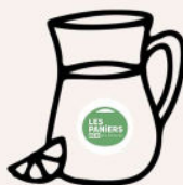
Jus de fruits pressés Idéal pour 6 à 8 personnes