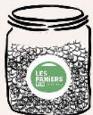
Bocal croquant 500g Mélange au choix Amandes et/ou noisettes

Boostez la journée de vos collaborateurs avec nos bocaux de fruits secs, pratiques à grignoter et remplis d'énergie !