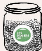
Bocal vitalité 500g Amandes, noisettes, raisins secs, abricots, figes séchés